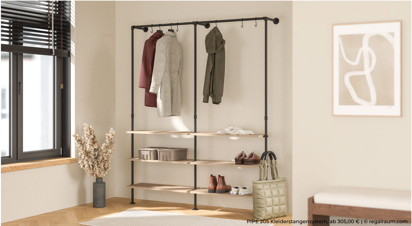
PIPE 205 Kleiderstangensystem, ab 305,00 €