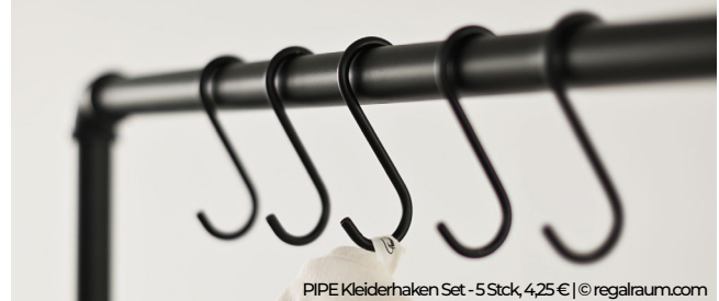
PIPE Kleiderhaken Set - 5 Stck, 4,25 € | © regalraum.com

Regalraum GmbH Werner-von-Siemens-Str. 13a 68649 Groß-Rohrheim Deutschland